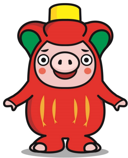
銀河連邦サンリクオオフナト共和国PRキャラクター おおふなトン