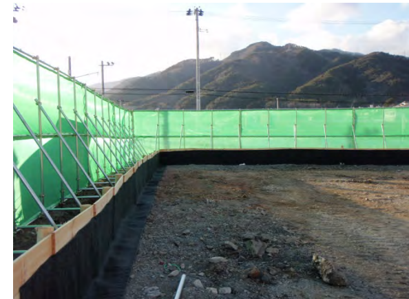
土砂流出防止柵の裏側 (流出防止マット)