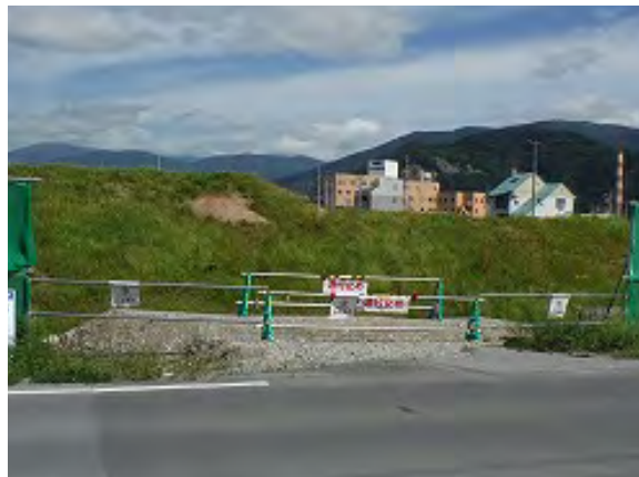
単管バリケードと防塵ネット