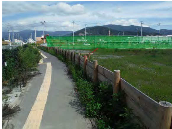
盛土着手前の状況

土砂流出防止柵の設置対象となる場所は、盛土高さがおおむね3m以上で、勾配が1:1.8よりも急な道路沿いになります。