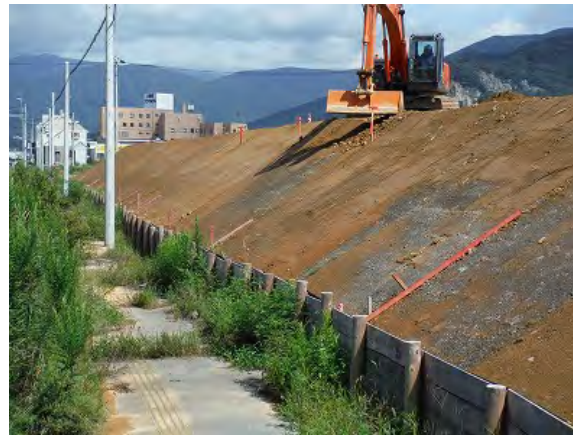
盛土施工時の状況