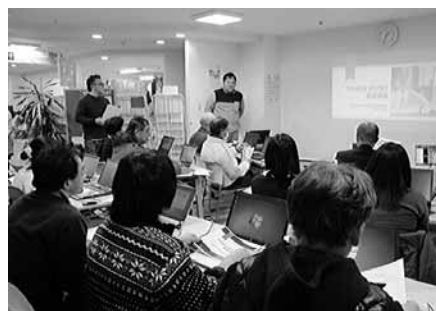
みんなで一緒に学ぼう会の様子

センターでは、活動を行う上で不可欠な事業の企画運営、資金調達、広報の仕方などについて学ぶ「みんなで一緒に学ぼう会」を毎月開催しています。