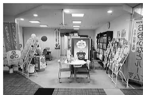
市民活動支援センターの様子