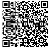
市ホームページ QRコード

本号に掲載した行事などにつきましては、新型コロナウイルス感染症の拡大防止などのため、中止や延期となることがあります。行事などに参加される際は、事前に市ホームページの確認や、開催団体の問い合わせをお願いします。 ▷問い合わせ先 秘書広報課広聴広報係(☎内線210)