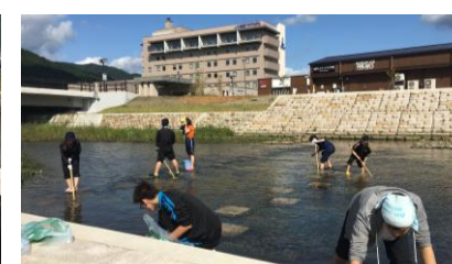
キャッセン・藻〜ストバスターズ