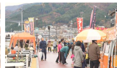
キャッセン・秋のマルシェ