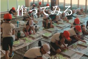
蓄光石で川底を彩ろう！