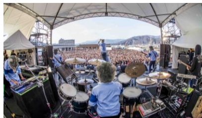
and NEXT STAGE 1