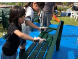
グリーンベンチプロジェクト