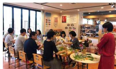
同士が連携し、ライフスタイルの発信や学びの場を提供する取組(キャッセン・マチコヤ)