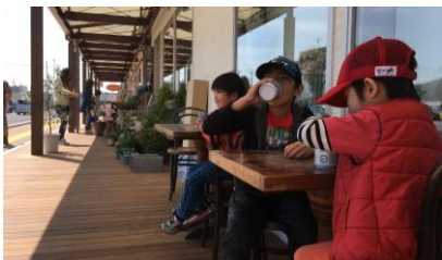
各店舗による店構えの工夫(陳列・ベンチ等)