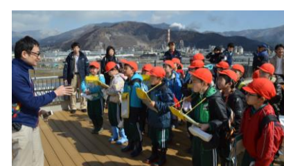
小学生向けの防災学習