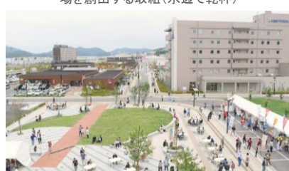
三陸ぐるっと食堂