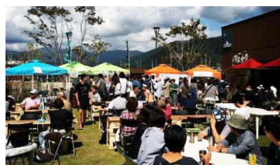
ベアレン・ビアフェスト