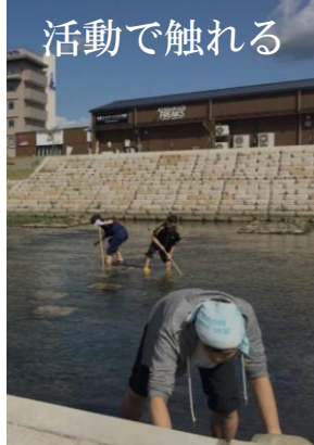
キャッセン・薬〜ストバスターズ