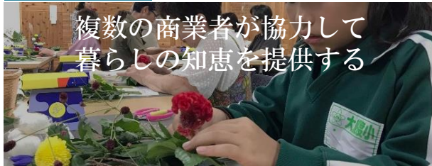
⑤菓子店×花屋 十五夜まんじゅうをアレンジする