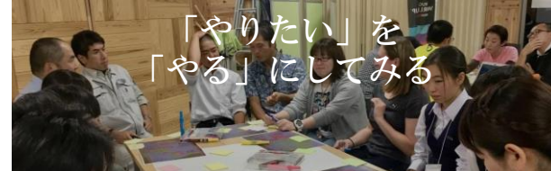
大船渡まちもり大学