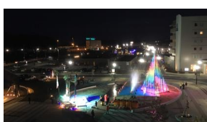
市民有志による漁火イルミネーション