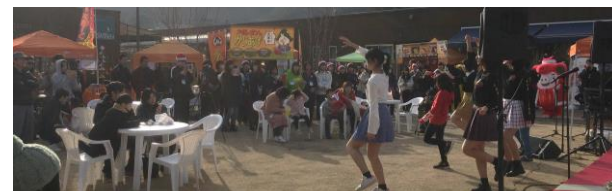
キラキラ★冬の学園祭