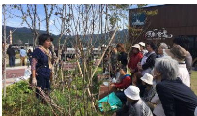
近隣住民等による花植活動