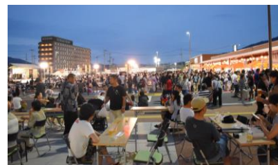
キャッセンの夏まつり