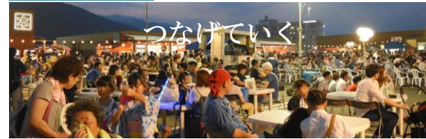
三陸・大船渡夏祭り