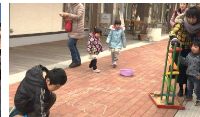
ストリートを遊び場として開放する取組