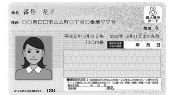
【マイナンバーカード見本】

住民票の写し、住民票記載事項証明書、印鑑登録証明書、戸籍全部事項証明書(謄本)、戸籍個人事項証明書(抄本)、戸籍の附票の写し、所得証明書、所得課税証明書