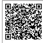
テイクアウト おおふなと

▷おおふなとブログ＝大船渡市観光物産協会で作成しているブログです。市内のローカルニュースを紹介しているほか、テイクアウトサービスを行う飲食店などを紹介しています。