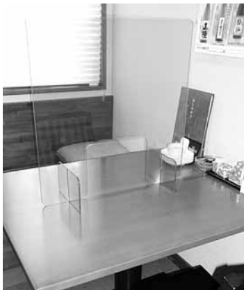
感染症対策を実施する飲食店

みを行っている事業者を支援するため、補助金を交付しています。左に、テイクアウトに対応した飲食店のメニュー、写真、連絡先などの店舗情報を紹介します(内容は、それぞれのホームページなどを確認ください)。