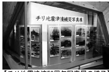
【チリ地震津波50周年写真展の様子】