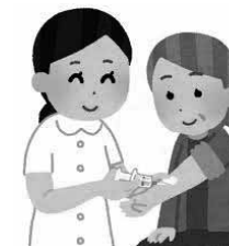
【表1】予防接種の対象年齢