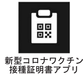
新型コロナウイルスワクチン接種証明書アプリ