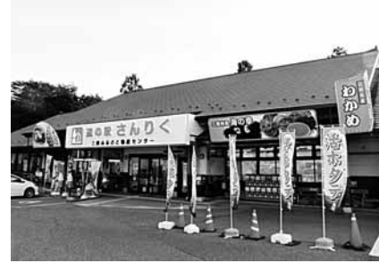
新鮮な海産物の料理や、販売なども行う「道の駅さんりく」