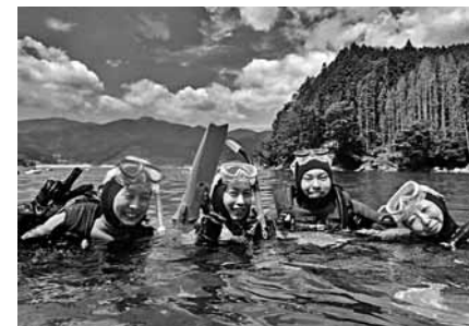
三陸町の海でのダイビング体験