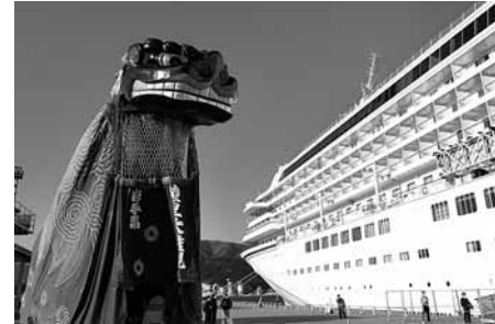
「踊る」大権現としては、日本一の大きさを誇る「綾里大権現」