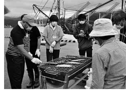
大船渡市でのみ取得できる「さんま焼き師」