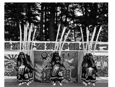
碓石海岸観光まつりでの郷土芸能の披露