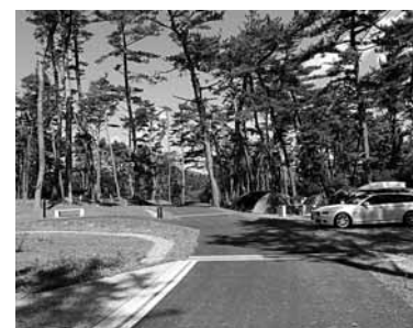
潮風と松林に囲まれた自然豊かな「碓石海岸キャンプ場」