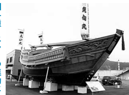
補修を終え、陸上展示されている気仙丸