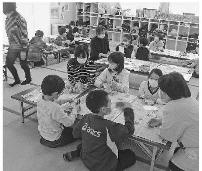
支援員の現行基準の維持を

73・3%を負担し、市は実質負担率26・7%で小中学校等の教室へのエアコン設置が可能になったが、当市の具体的な実施計画は。 答 次長 当市では、小中学校の普通教室及びこども園の保育室166室、理科室、音楽室や遊戯室など特別教室119