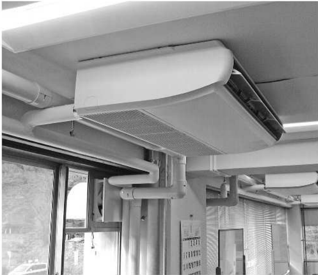
小中学校にエアコン設置を

答 市長 地方分権改革有識者会議において、「従うべき基準から市町村が柔軟に設定できる『参酌基準』へ見直す方針案をまとめた。今後、閣議決定を経て、正式に参酌基準への見直しが進められるが、当市は、利用する児童の安全や有資格者による育成支援の質を確保する観点から、当面は、現在の基準を維持する方向で検討を進めている。保護者が子育てと仕事を両立し、安心して子どもを育てることができるよう支援施策の充実と強化に努めていきたい。(他に、企業の従業員確保、高齢者等の見守り強化、こころのケアの取組、ホタテの貝毒対策も質問。)