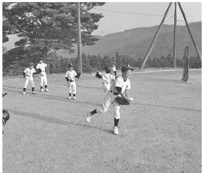
スポーツ少年団への支援を

の支援を行っている。さらに、市体育協会では、競技別協会やスポ少が市外に遠征する際、協会が保有するマイクロバスの貸出しを行うなど関係団体と連携し、様々な支援に努めている。こうした中、提言のあった遠征費や用具費等は、子どもたちが自ら希望する部活動やスポ少活動に取り組み上で必要なものということと踏まえ、保護者負担とするのが基本であると考えており、当面これまでの支援事業を継続していく。