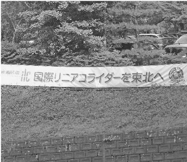
ILC誘致の判断は近い

平成29年市議会第2回定例会の一般質問は、6月14～16日の3日間行われ、12名の議員が登壇し、市政全般にわたり、活発な議論が交わされました。その要旨を質問順に紹介します。