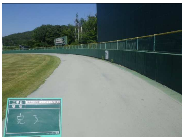
【ウォーニングゾーン修繕】