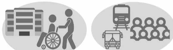
受診時や医療機関・高齢者施設などを訪問する時