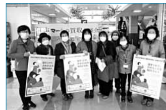
「女性に対する暴力をなくす運動」啓発活動