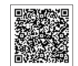
岩手県ホームページ

用などがあります。 ■認定店になるためには 県が設定している廃棄物抑制、リサイクルなどの「取組基本項目」を5つ以上行い、取組計画書を作成の上、申し込みください。 制度の詳細は、岩手県ホームページをご覧ください。 ▼申込先・問い合わせ先 岩手県環境生活部資源循環推進課 資源循環担当 (☎019-629-5367)