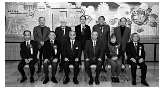
～長年にわたり、地区・地域のリーダーとして 公民館運営や地域の活性化にご尽力いただきました～