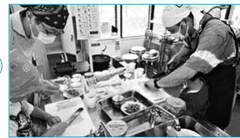
父子(おやこ)の料理教室