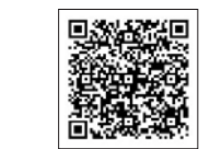
環境省ホームページ

「うちエコ診断」は、環境省の「うちエコ診断ソフト」により、家庭の光熱費や二酸化炭素排出量を把握することができます。診断を行うことで、ライフスタイルに合わせた効果的な省エネや、光熱費の節約方法などをアドバイスしています。地球温暖化防止のため、うちエコ診断をしてみませんか？