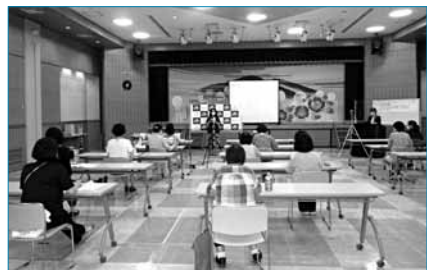
岩手大学と共催した キャリア形成支援セミナー