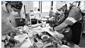
父子(おやこ)の料理教室