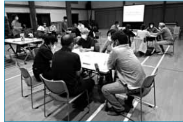
(仮称)男女共同市民会議の開催イメージ