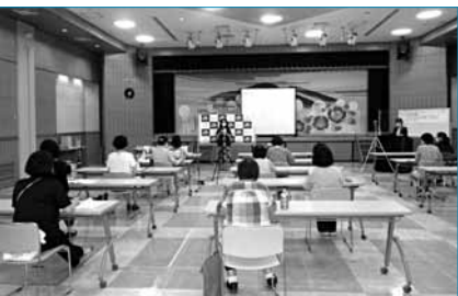
岩手大学と共催した キャリア形成支援セミナー