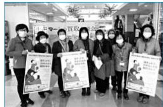
「女性に対する暴力をなくす運動」啓発活動