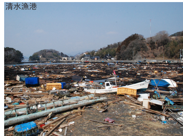
被災後 2011/3/13