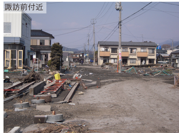
被災後 2011/3/13