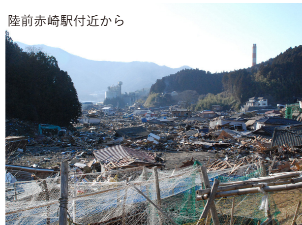
被災後 2011/3/12