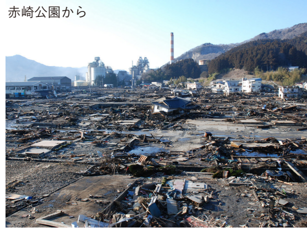
被災後 2011/3/12