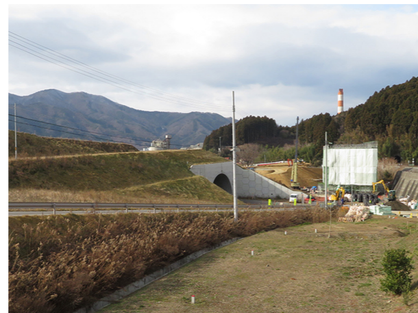
10年目の記録 2020/12/24