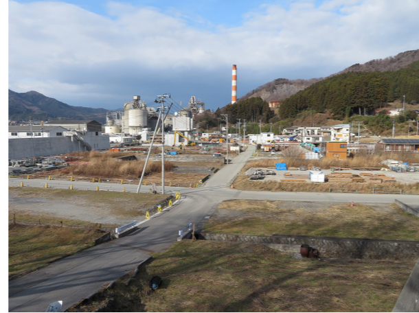
10年目の記録 2020/12/24