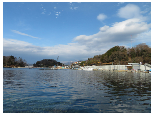
10年目の記録 2020/12/24