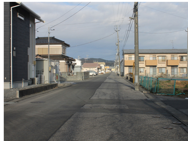
10年目の記録 2020/12/23

海岸近くの低い土地には、工場や住宅などが広がっていましたが、湾の奥まで押し寄せた津波は、避難所を取り囲み、陸の孤島にしてしまいました。