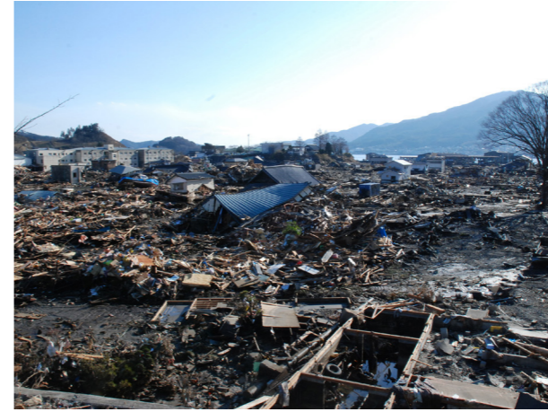
被災後 2011/3/12

海岸近くの低い土地には、工場や住宅などが広がっていましたが、湾の奥まで押し寄せた津波は、避難所を取り囲み、陸の孤島にしてしまいました。