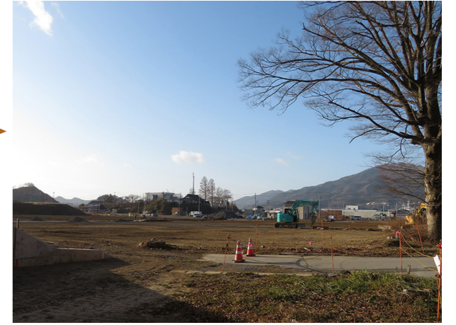
10年目の記録 2020/12/25

被災した赤崎小学校と赤崎中学校は高台に再建され、赤崎小学校の跡には、支援により人工芝のグラウンドが整備されています。