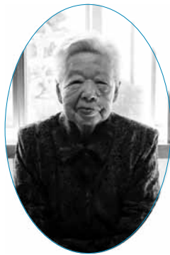
※記事の掲載について了承を得た人を紹介しています。

長寿の秘訣を、「好きな畑仕事で体を動かしていること」と笑顔で話してくださいました。畑仕事は今でも現役です。なんでもよく食べますが、中でもお刺身が好物だそうです。