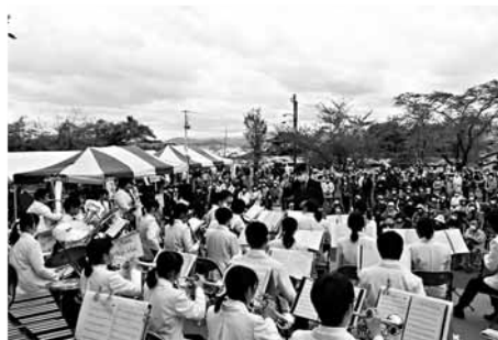
【昨年の碁石海岸観光まつり】

▽その他 ・両日、臨時駐車場からまつり会場まで、無料シャトルバスを運行します。なお、駐車場には限りがありますので、公共交通機関の利用や乗り合わせにご協力ください。 ・まつり期間中は、「世界の椿館・碁石」と「市立博物館」に無料で入館できます。