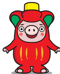
大船渡市PRキャラクター 「おおふなトン」