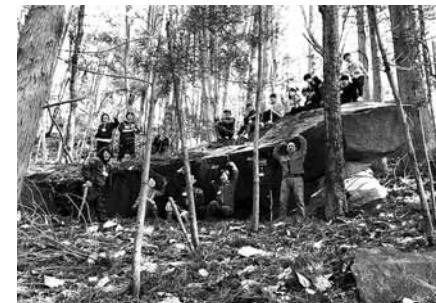
浦浜の石切り場【おきらい遠足で撮影】

市は、ともに協働するまち づくりを目指しています。 このコーナーでは、大船渡 市市民活動支援センターの協 力のもと、市内の市民活動団 体やイベント情報などを紹介 します。第109回は「越喜 来活性化協議会「交流部会」 」の紹介です。