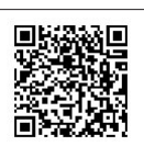
市対象キャッシュレス決済サービス