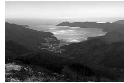
夏虫山から見た越喜来【おきらい遠足で撮影】

本年度は、越喜来の人たちが、もっと楽しめるような企画や、みんなが集まれる場をつくりたいと考えています。私たち交流部会は、若手のパワーと部会全員の協力で、みんなが一つになって、越喜来を盛り上げようと強い思いで活動しています。