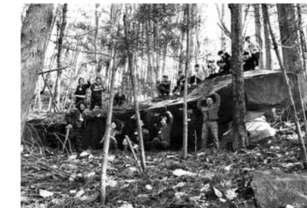
浦浜の石切り場【おきらい遠足で撮影】

また、今年の3月には、「おきらい遠足」として、越喜来小学校5・6年生を対象に、浦浜・甫嶺・崎浜の名所歩きをしました。