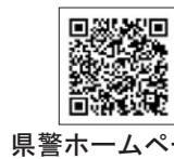
県警ホームページ

▽選考期日 6月18日(日) ▽時間 午前9時から ▽会場 岩手県警察本部(盛岡市) ▽選考内容 教養検査、作文検査、人物検査、身体検査 ▽受考資格 令和5年4月1日における年齢が40歳未満の人 ※このほかにも、船舶に関する資格要件があります。 ▽採用予定人数 2人 ▽受付期限 5月19日(金) ▽その他 詳細は問い合わせください。 ▽問い合わせ先 岩手県警察本部警務課人事係(☎0120・204034)