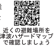
近くの避難場所を津波ハザードマップで確認しましょう