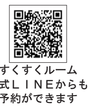
すくすくルーム 公式LINEからも 予約ができます