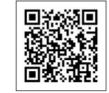
熱中症予防情報サイト(環境省)

熱中症警戒アラートの発令状況や、詳しい熱中症予防法については、環境省の熱中症予防情報サイトをご覧ください。 ▽問い合わせ先 健康推進課(☎271581)