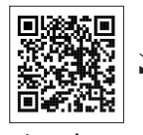
センター ホームページ