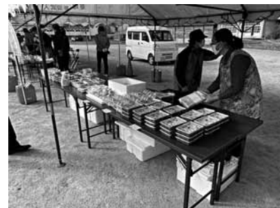
軽トラ市では、町内の農産物や加工食品などを販売

市は、ともに協働するまちづくりを目指しています。このコーナーでは、大船渡市市民活動支援センターの協力のもと、市内の市民活動団体やイベント情報などを紹介します。