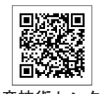
水産技術センター ホームページ