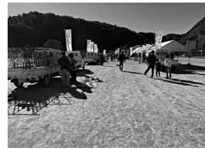
昨年10月30日に「第1回軽トラ市」を開催

このうち「稼ぐ部会」は、農林商工業の振興および地区内の経済循環の促進を基本方針として、活動しています。