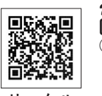
サークル ホームページ