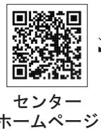
センター ホームページ