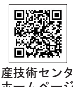
水産技術センター ホームページ