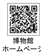
博物館 ホームページ