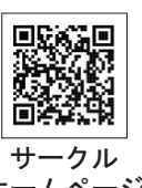
サークル ホームページ