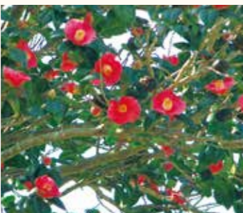
↑ヤブツバキ(12月～5月が見頃)