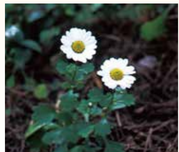
↑コハマギク(9月～11月が見頃)