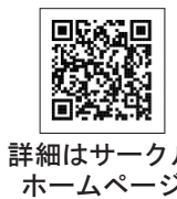
詳細はサークルホームページ