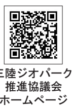
三陸ジオパーク推進協議会ホームページ