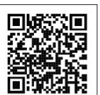
岩手県下水道公社ホームページ