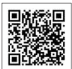
詳細は市ホームページをご覧ください