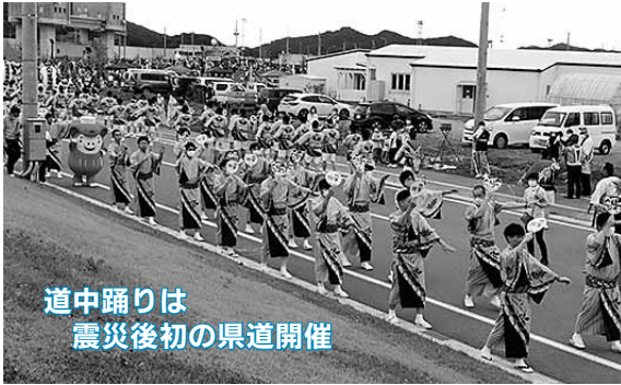
道中踊りは 震災後初の県道開催

編集・発行／大船渡市企画政策部秘書広報課(〒022-8501 岩手県大船渡市盛町字津野沢15番地 ☎0192⑦3111 FAX0192⑥4477)