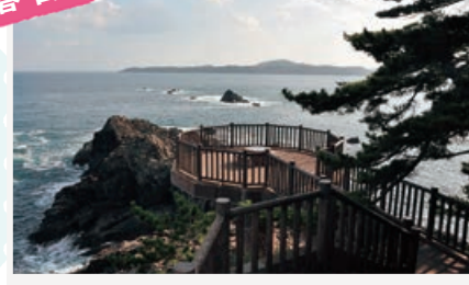
眼前の大海原にすべてを忘れる瞬間