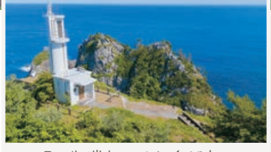
山の先端部にはXT台があり、 ここから眺める岬の連なりは絶景です！