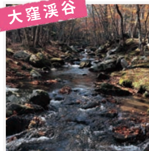
若葉・新緑・紅葉… 四季を楽しむ。

風光明媚なリアス海岸に位置し海のイメージが強い大船渡市ですが、四季折々の表情をもった山々や溪谷にも囲まれています。若葉、新緑、紅葉と季節を肌で感じることができます。海と山の景観を同時に味わえる贅沢なひとときをお過ごしください。