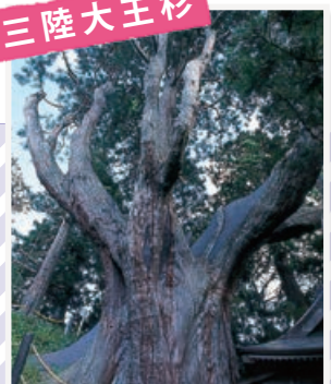
一説によると樹齢7000年以上とも言われる大木