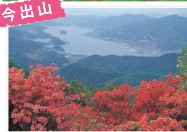
大船渡湾を望むツツジの名所。