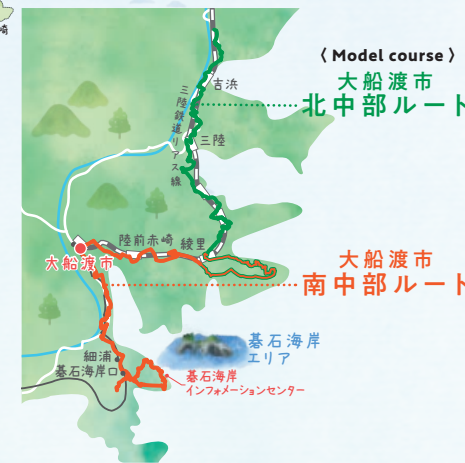
(Model course) 大船渡市北中部ルート