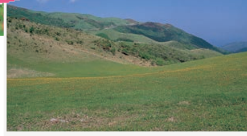
山頂まで車でドライブ！ ホンシュウジカに高確率で遭遇