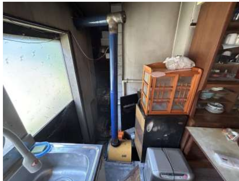
台所内勝手口/風呂釜