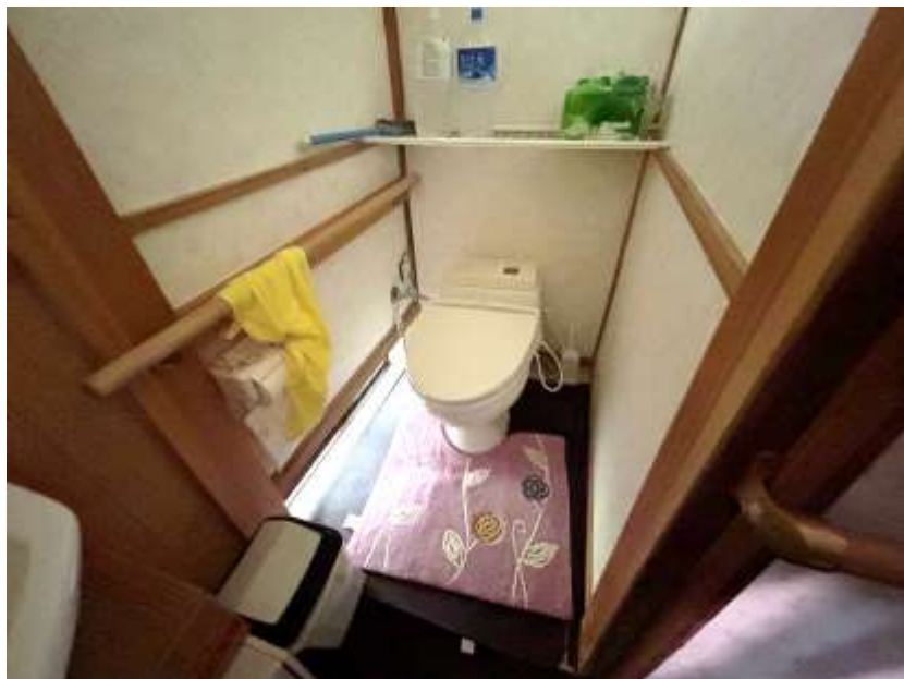
トイレ（汲み取り式－簡易水洗）