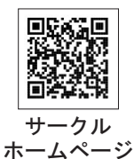
サークル ホームページ