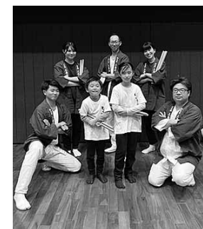
和太鼓の普及を目指し日々活動しています