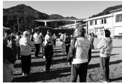
迅速な避難行動ができるよう、日ごろから避難場所を確認しておきましょう

9月29日(金)に、マグニチュード7.3、震度5弱の地震が発生し「北海道・三陸沖後発地震注意情報」が発表された。