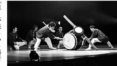
東北太鼓感謝祭では大迫力の演奏を披露しました

市は、ともに協働するまちづくりを目指しています。このコーナーでは、大船渡市市民活動支援センターの協力のもと、市内の市民活動団体やイベント情報などを紹介しています。