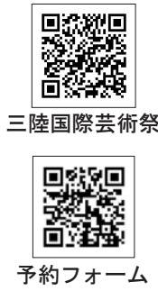
三陸国際芸術祭 予約フォーム

三陸国際芸術祭三陸芸能大発見サミット事務局 【みんなのしるし合同会社】 (☎05123)