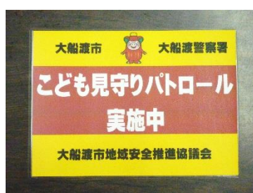
平成 28 年度版