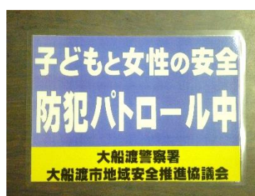
平成 29 年度版