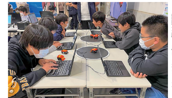
熱戦が繰り広げられました

10月8、9日、大船渡駅前広場(おおふなぼーと前)で第41回大船渡市産業まつりを開催しました。まつりでは、歌やダンスなどのステージイベントのほか、市内の秋の味覚が堪能できる飲食コーナーなど、多彩なお店が出店。また、キャッセン秋まつりも同時開催され、お魚タッチプールなど体験コーナーも充実しており、大人から子どもまで多くのお客さんと賑わっていました。