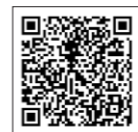
納期限、納付方法についてはこちらをご確認ください。