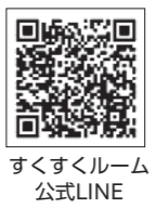
すくすくルーム 公式LINE