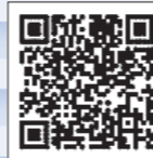
市公式YouTube チャンネル