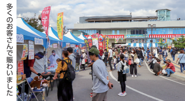
多くのお客さんと賑わいました