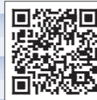
市公式X (旧ツイッター)