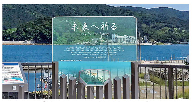
「祈りのモニュメント」完成イメージ

うにとの願いが込められています。「祈りのモニュメント」からは復興した街並みと海が望め、震災の記憶を風化させることなく未来への教訓につなげることができます。また、犠牲者の御芳名は、2次元コードによりスマートフォン上で閲覧でき、毎年3月11日を含めた一定期間、スロープ路へ芳名板を設置する予定です。▶問い合わせ先＝防災管理室(☎内線293)