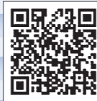
市公式 フェイスブック