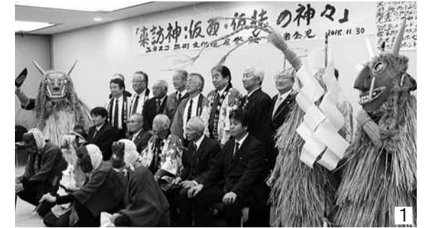
①後世への継承を誓い合う関係者 ②小正月の晩に仮面・仮装の「スネカ」が家々を訪れる三陸町吉浜地区の行事