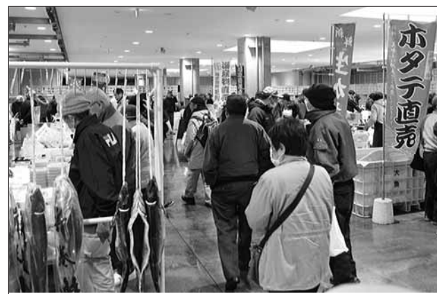
(7) 広報大船渡 31.1.8(No.1142)

5回目を迎える同イベントは、大船渡魚市場買受人組合が主催。大船渡ならではの新鮮な海の幸や加工品を取りそろえた地元の水産加工業者などが集結し、会場内は威勢の良い掛け声が響く中、当日限りのお買い得品を買い求める大勢の来場者でにぎわいました。