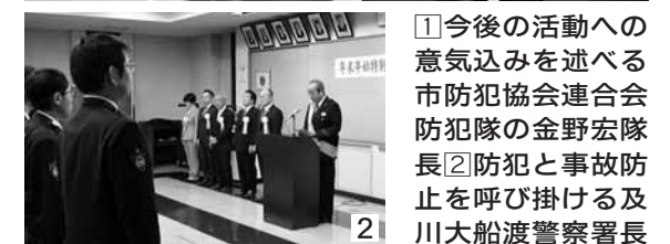
①今後の活動への意気込みを述べる市防犯協会連合会防犯隊長 ②防犯と事故防止を呼び掛ける及川大船渡警察署長