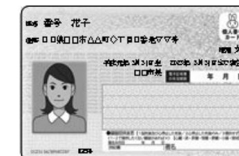
マイナンバーカード(イメージ)