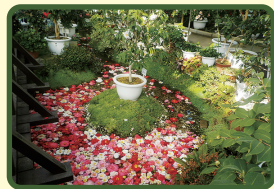
※写真は昨年度のものです