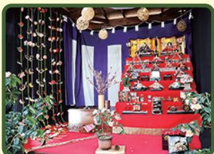
※写真は昨年度のものです