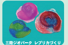
三陸ジオパーク レプリカづくり

2/11(日)10時半～13時半～ 企画展・常設展示 解説会 参加無料、申込不要 2/25(日)10時～15時 レプリカづくり体験会 参加料100円、申込不要