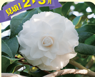
ポップ・ジョン23世