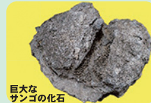
巨大なサンゴの化石