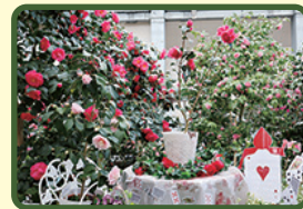
※写真は昨年度のものです