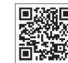
消防組合ホームページ