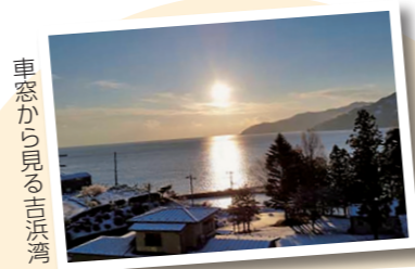
車窓から見る古浜湾