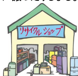
リサイクルショップを利用

リユースとは、繰り返し使うことです。壊れたものを直して使ったり、いらないものでも捨てないでリサイクルショップを利用したり、誰かに譲ったりしましょう。