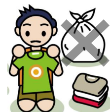
着る服はおさがり