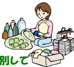
ごみは分別してリサイクルへ