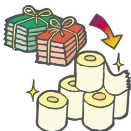
リサイクル商品（再生品）を購入

リサイクルとは、再生して資源として利用することです。資源を分別して有効利用したり、リサイクル商品を買ったりして、リサイクルに取り組みましょう。