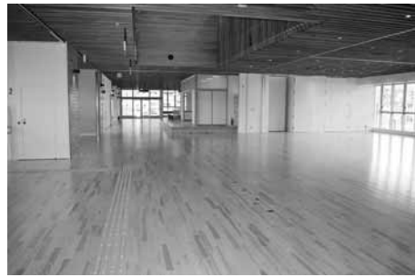
2階コロバストリート

5月12日(土)、13日(日)、19日(土)、20日(日)、26日(土)、27日(日)は、午前10時から午後3時まで、多目的室、展示室、コロバストリートを見学できます。