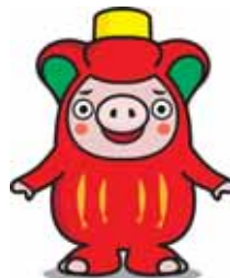
大船渡市PRキャラクター 「おおふなトン」