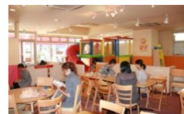
写真: 遊び場とカフェ空間 / 出典: 船越流権 ( http://bit.ly/2u2A9o7 )