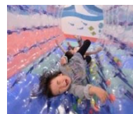
写真: 遊具