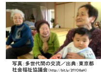
写真: 多世代間の交流