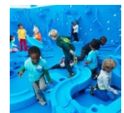
写真: ビッグ・ブロック / 出典: 潮博ーネランド ( http://bit.ly/2u4EYvR )