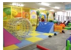
写真: Kid's USLAND 本校5番街店 / 出典: かわく子育て研究所 ( http://bit.ly/2qms748 )