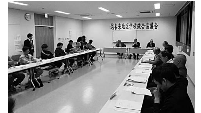
第1回越喜来地区学校統合協議会の様子

今後、協議の推移をみながら、統合受け入れ校を有する地区(中学校区)でも同様の協議会を設置し、最終的には、両地区合同協議会で統合の確認、方式および時期などについて協議する流れで取り組んでいきます。