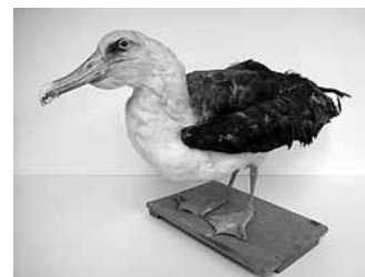
コアホウドリの剥製