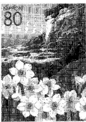
日本郵政 花の咲く風景