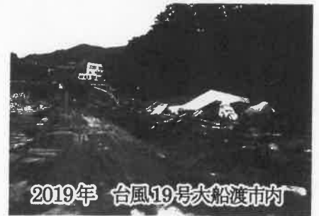
2019年 台風19号大船渡市内