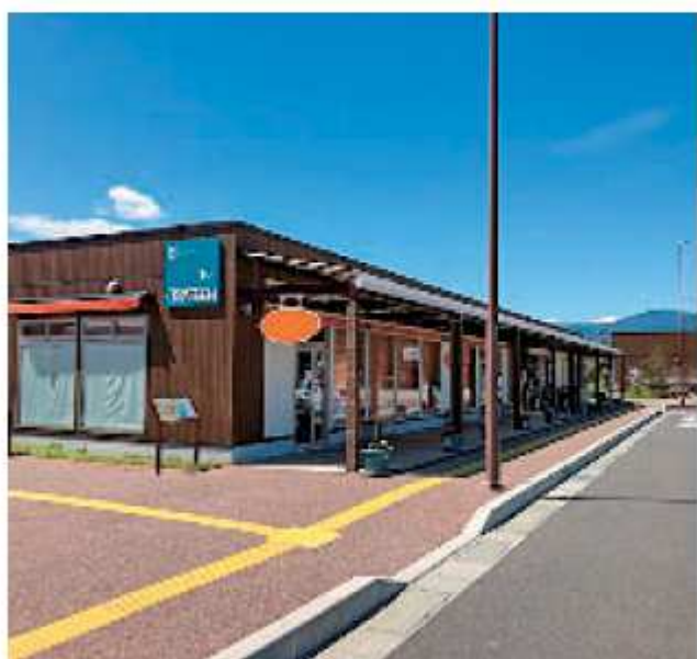
コロナ禍のキャッセン商店街

工会議所や商店街からふるさと振興券に対して高い評価をいただいております。加えて継続実施の要望があることから、消費喚起策を中心とした支援を行っていきたくと考えている。県の経営支援金支給事業への上乗せ支援については、今のところは考えていないが、引き続き、国や県の経済対策の動向や市内経済の状況を注視しながら、より効果的な支援策について検討していきたい。