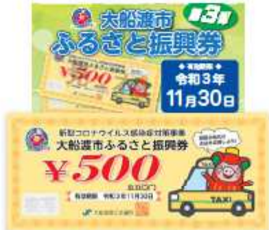
ふるさとと振興券(第3弾)配布 1世帯1万円(タクシー利用などにも)