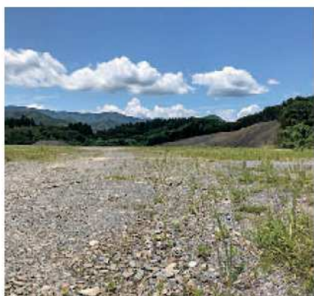
旧大船渡総合公園予定跡地（長洞仮設住宅跡地）

答 部長 引き続き、海洋放出によらない処理保管方法の検討と、漁業関係者等に説明し、不安を払拭し理解を得るよう、国に対して要望していく。