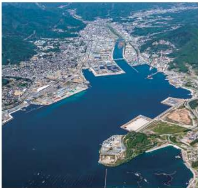
I L C 誘致に向けた大船渡港

問 I L C (国際リニアコライダー) 誘致実現は当市にとっても、当県にとっても復興後の未来に