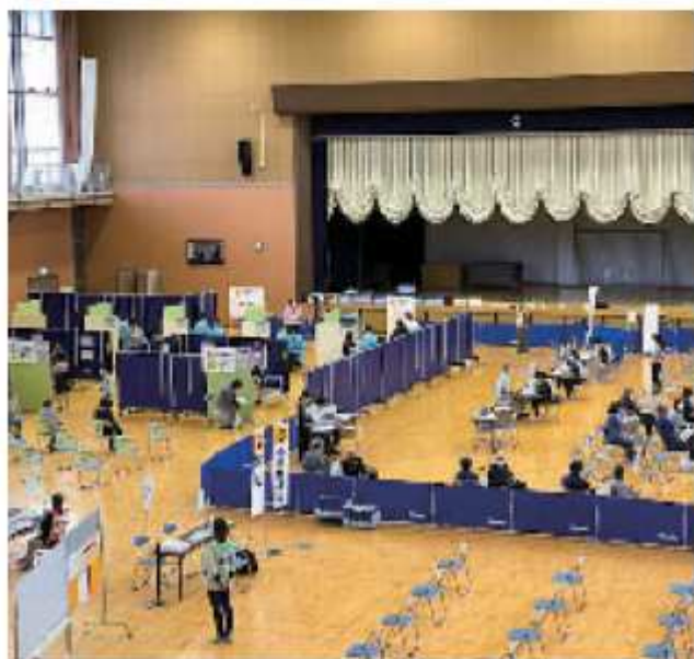
ワクチン集団接種会場

6月議会は11名の議員が登壇し、新型コロナウイルスワクチン接種やさまざまな市政課題で活発な論戦がなされました。