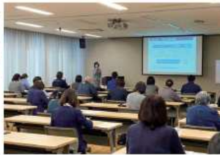
大船渡商工会議所に対しコロナ対策の取組費用を補助 300万円