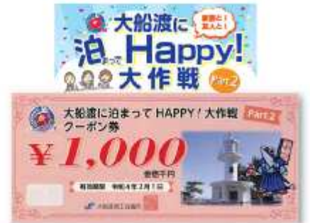
宿泊観光回復事業 宿泊料金を上限に4,000円を助成併せてクーポン券1,000円分も交付