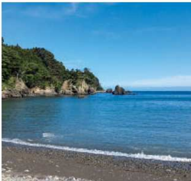
放出予定の太平洋

問 社会人となった若者が奨学金を返還するのは、月々の負担が重い。その返還を肩代わりして