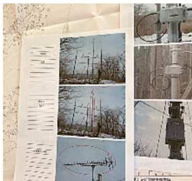
改修費用の負担増加が懸念

や県に対する補助制度の創設・拡充について要望を行ってきた。今後、各組合では高齢化や人口減少の進行により、加入者減少による組合自体の存続が危ぶまれるほか、改修費用に係る組合員一人当たりの負担増加が懸念されることから、市としても、引き続き県への要望を行いながら、各組合とともに将来的なあり方を含めた長期的な対応策を検討していく必要があると考えている。