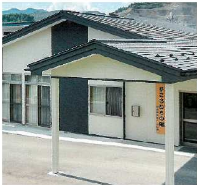
市内の小規模多機能型居宅介護施設

問 第8期介護保険事業計画では、吉浜と盛地区での小規模多機能型居宅介護施設と、盛と大船