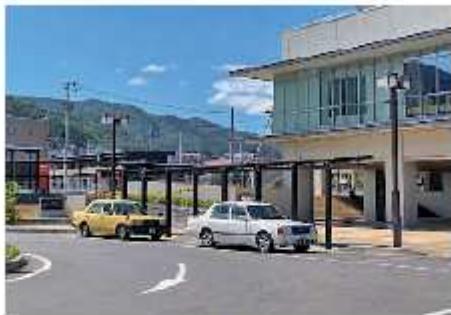
ワクチン接種移動支援 480万円 障がい者などが接種会場へ移動する際にかかるタクシー費用を助成