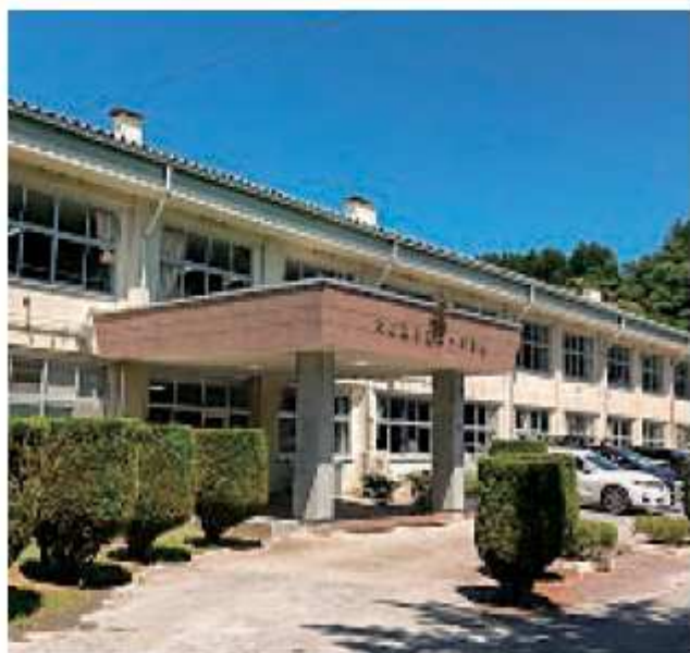
改築予定の第一中学校

問 大船渡総合公園予定跡地（長洞地区）からの土砂搬出による岩手県の「永浜・山口地区港湾