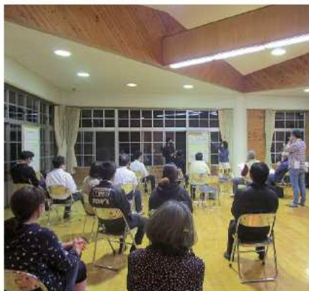
日頃市町協働まちづくりワークショップ

答 部長 8月上旬か ら11月末までを利用期間 に「大船渡市ふるさと振 興券」の第3弾を実施し、 切れ目なく、消費喚起を 図っていく。当市として も、大船渡商工会議所と 連携しながら、商店街と しての賑わいを維持し、 事業を継続できるよう、 中小企業振興など賑わい 創出や空き店舗活用に関 する補助制度の活用を図 るなど、適切な支援策を 講じるように努めてい く。