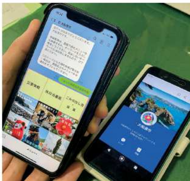
LINE 大船渡市公式アカウント

財源である。寄付金額を県内市町村と比較すると 2018 年 13 位、2019 年 14 位であった。今年度 1 億 8 千万円を目指しているが、取組次第では寄付金額を増加させることは可能と考えるが。 答 部長 寄付の増加に向け、より魅力的なお礼品の発掘、お礼品取扱業者の新規参入の促進が必要である。コロナ禍の寄付者の寄付・購買意欲を追い風とし、時機を逸することなく、取組を進めていく。