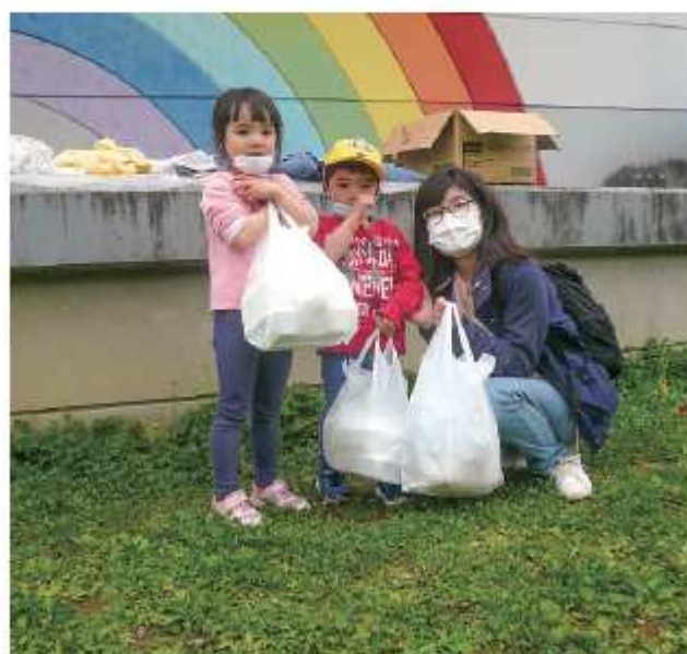
笑顔の花が咲きました

答 部長 持続可能な 地区づくりは、一朝一夕 に成就するものではなく、 長い時間かけて地区 住民への浸透を図ること が肝要との認識の下、地 区運営体制が、地区運営 組織へ移行した後も円滑 に促進されるよう、市と しても大船渡市市民活動 支援センターとともに、 随時フォローアップする こととしている。