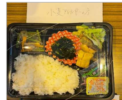
アレルギー代替食の提供