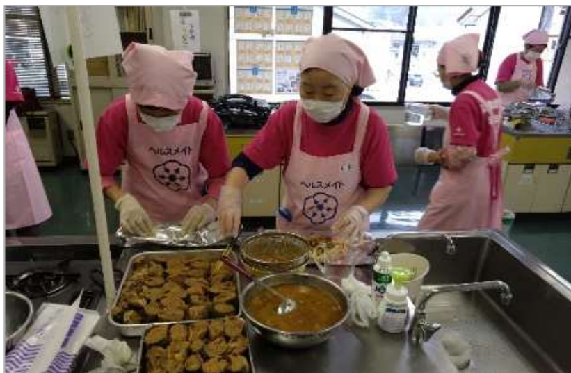
食生活改善推進員による家庭料理の提供