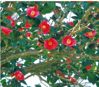
↑ヤブツバキ(12月～5月が見頃)