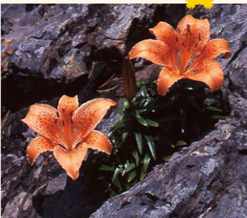
↑スカシユリ(7月～8月が見頃)