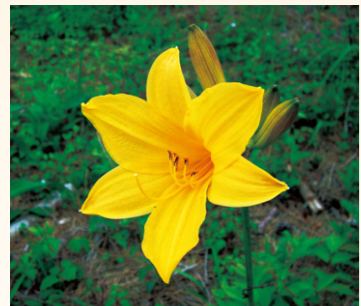
↑ニッコウキスゲ(6月が見頃)