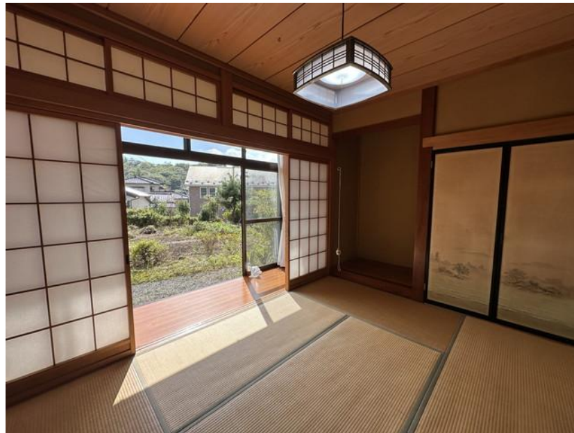
1階 和室 6畳①