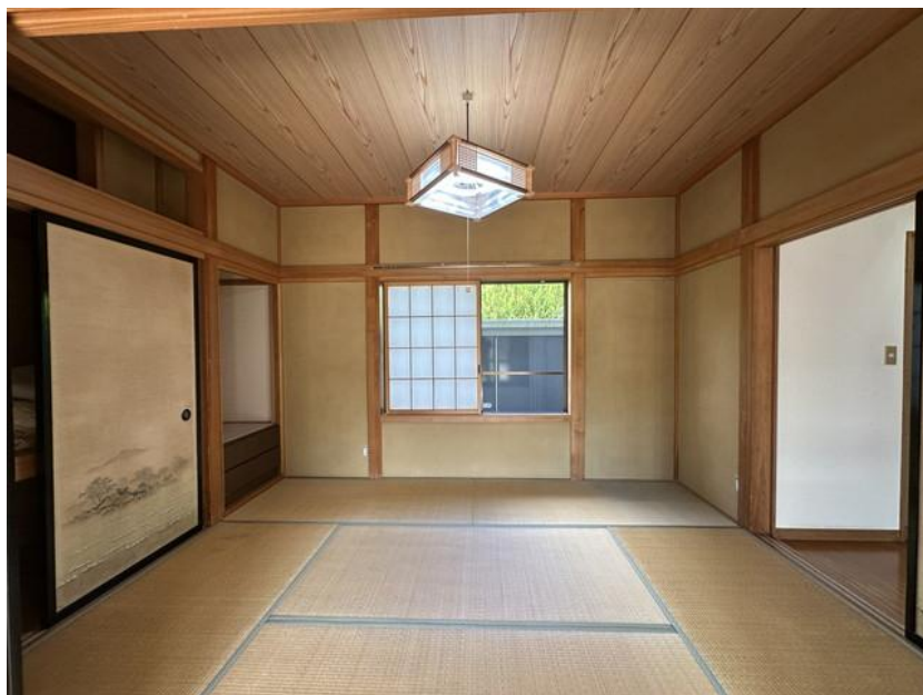
1階 和室 6畳②