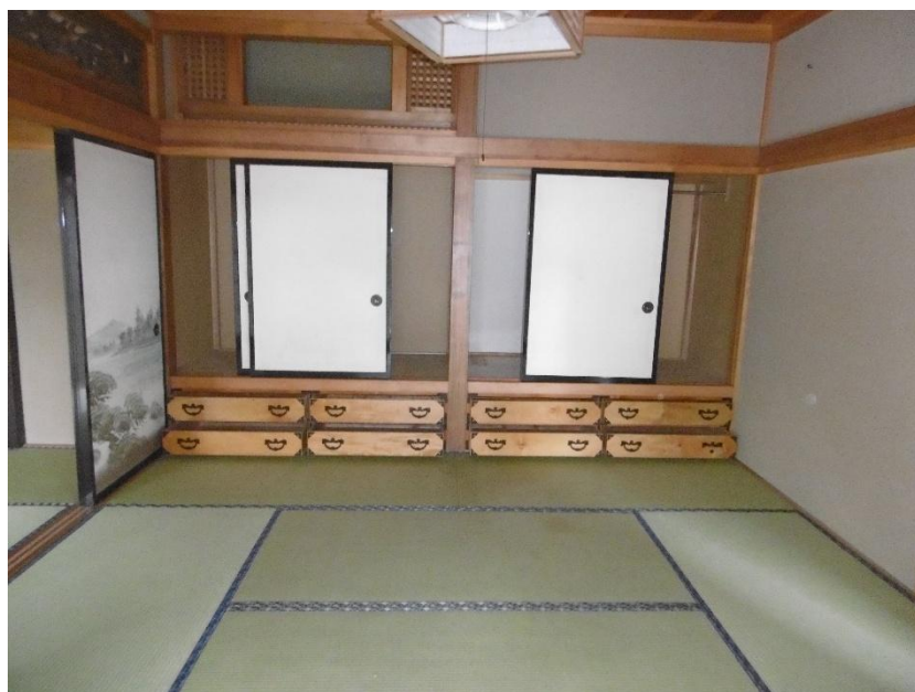
1階 和室 8畳①