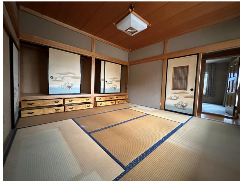
2階 和室 8畳