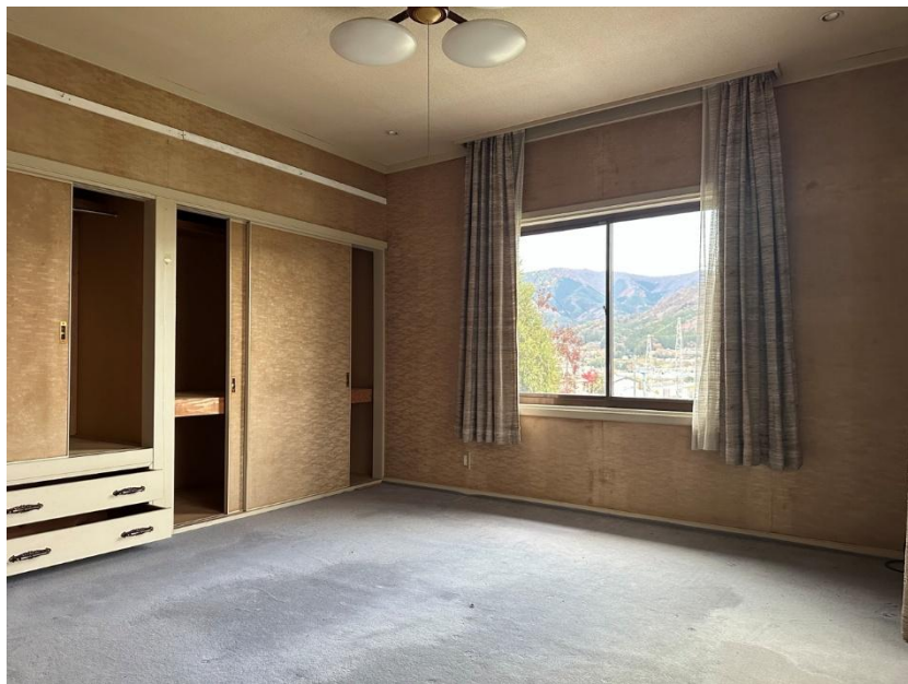
2階 洋室 8畳